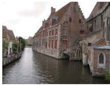
ブルージュの運河