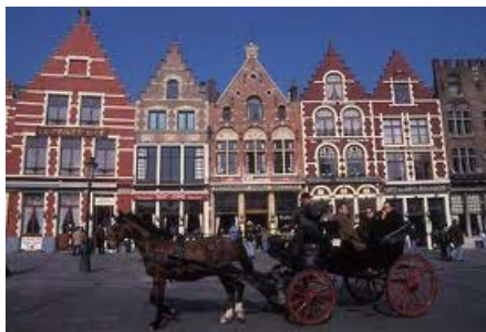
ブルージュの街並み

プリマでは、外観デザインが4パターンあり、その中の一つにオーストラリアレンガを使ったデザインがあります。年数を重ねれば重ねるほど表情や雰囲気が変わっていく様を見られるのも煉瓦の楽しみの一つです。